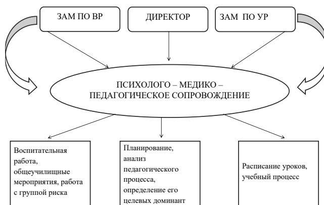
Таблица 1 Модель внутреннего взаимодействия

Воспитательная работа планируется и строится на принципах сотрудничества, доверия, уважения, развития самоорганизации студентов на основе модели внутреннего взаимодействия (схема)